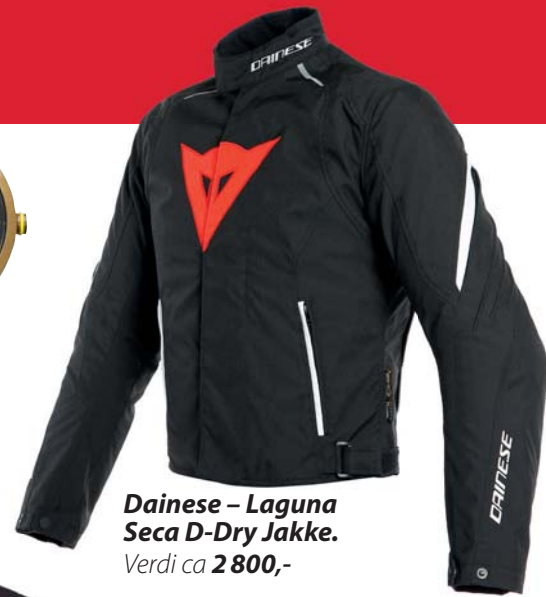
Dainese – Laguna Seca D-Dry Jakke. Verdi ca 2 800,-