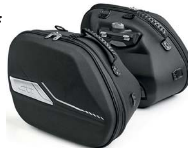
Fra Norsk Motor Import AS: Valgfritt Givi utstyr til 3 000,-