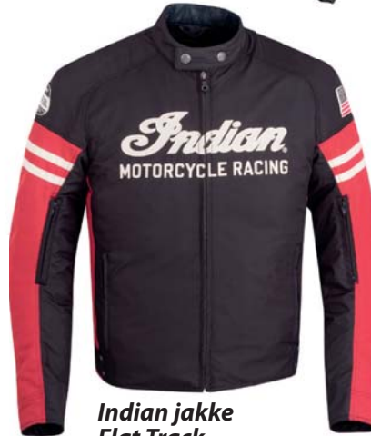
Indian jakke Flat Track. Verdi ca 2 791,-