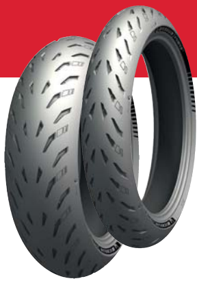
Fra Norgesdekk: Michelin Power 5. Verdi ca 5 535,-