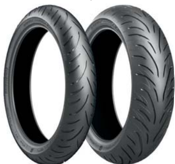
Bridgestone T31. Verdi ca 5 500,-