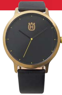
Husqvarna Armbandsur. Verdi ca 1 300,-