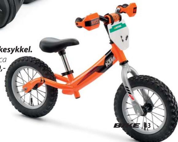
KTM Sparkesykkel. Verdi ca 1 300,-