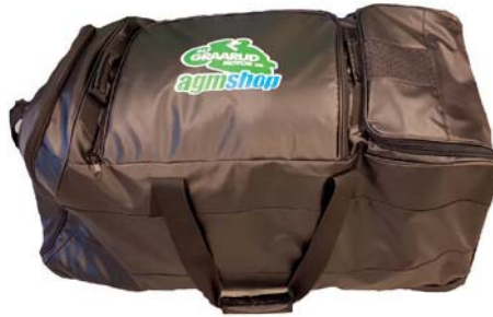
Fra AGM Alf Graarud: Pakke med AGM- produkter. Stor AGM-Bag, sokker, tskjorte og pakksekk. Verdi ca 1 500,-