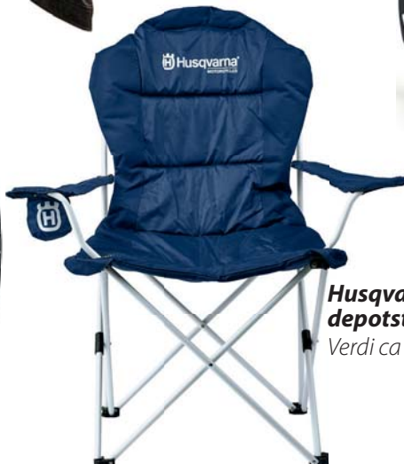
Husqvarna depotstoler. Verdi ca 1 000,-