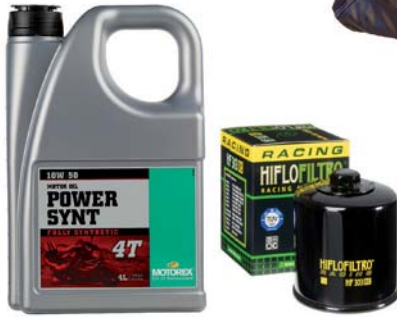
Fra SPS: Olje og oljefilter. Verdi ca 1 073,-